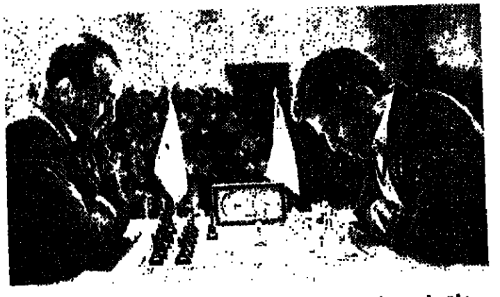
بدأت في موسكو مباراة الريع النهائية للمتافين على بطولة العالم في الشطرنج بين الاستاذين السوفيتيين الكبارين الكسندر بيليافسكي (ال اليسان) وهاري كاسباروف ، وهما يشتركان لأول مرة في مثل هذه المباريات .

ذكرت اللجنة التنفيذية من ايساعيا الاخير ان لاعبي الجيزان من ثلاثين بلد يستعدون للمشاركة في المباريات الدولية العاشرة في الجيزان الرياضي على جائزة «الياه» موسكو . ونود تذكير القراء بان المباريات ستجرى من ٢٥ حتى ٢٧ آذار (مارس) الجيزان بملعب لينين المركزي . وستقام في صباح السابع والعشرين من الشهر المذكور في قصر الرياضة «اسپانيلور» المباريات الاضافية النهائية للرايحين الناشئين في المباريات التمهيدية . من المتوقع ان تصل الى موسكو